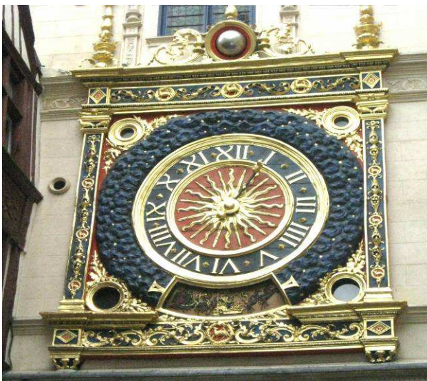
Große Uhr (Gros-Horloge) in Rouen