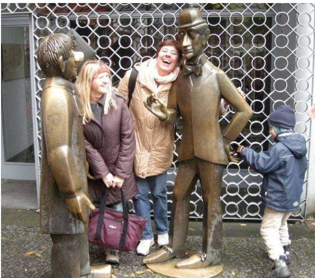
Tünnes und Schäl mit zwei Verehrerinnen