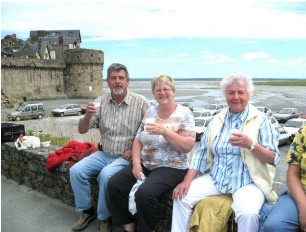
Nach soviel Kultur war ein Picknick auf der Mauer wohlverdient.

Nach dem Mittagessen fand der Besuch des Museums für Meeresforschung statt. Auf der Rückfahrt betrachteten wir noch am Kirchturm von St.-Mere-l'Englise das Denkmal, das an den Fallschirmspringer erinnert, der damals am Turm hängengeblieben war und von den Feinden nicht abgeschossen wurde, weil er sich ganz still verhielt.