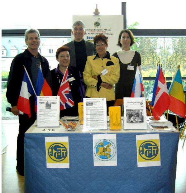
Flagge zeigte die Sektion Darmstadt mit ihrem Stand.

Unter dem Motto „Ihr seid das Programm“ hatte die Stadt Darmstadt am 3. Oktober 2008 zum ersten Mal den „Tag der Vereine“ veranstaltet. Mehr als 160 Vereine nutzten die Gelegenheit, ihre Vereinsarbeit an einem Stand vorzustellen. Den Besuchern standen „Vereinsexperten“ Rede und Antwort und im direkten Gespräch konnten Kontakte zu Interessenten hergestellt werden.