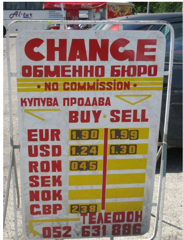
Ein Wermutstropfen im visafreien Reiseverkehr! Nicht überall in der EU ist der Euro auch Landeswährung.

Da wir alle keine Hellseher sind, lässt sich auch heuer vorerst noch nicht konkret voraussagen, wann