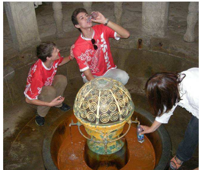
Nasdorowije mit Heilwasser des Bad Nauheimer Sprudelhofs.