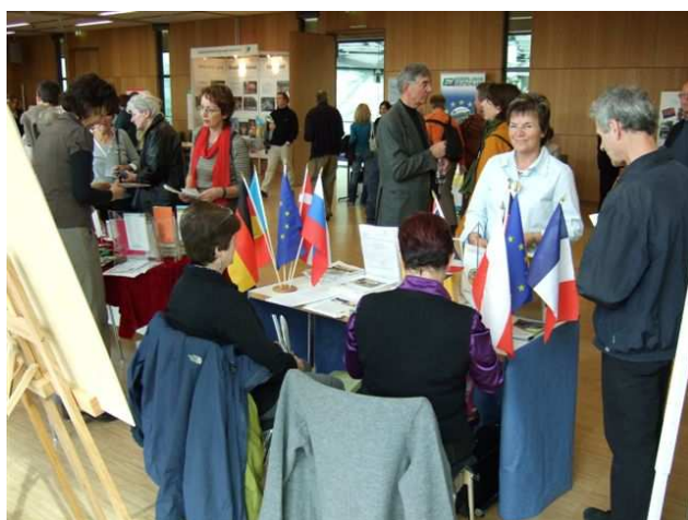
Besucher am Stand unserer Sektion.

Auch unsere Sektion hat am „Tag der Vereine“ mit einem eigenen Stand teilgenommen. Die Standmannschaft, unter Ihnen Vorstands- und andere Mitglieder, informierte über die Aktivitäten unseres Vereins und verteilte Informationsmaterial.