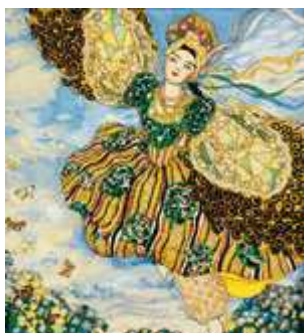
Konstantin Somow, Buchumschlag für Konstantin Balmonts "Feuervogel", 1907, Staatliche Tretjakow-Galerie, Moskau

Am 19. November 2008 haben 23 Jumeleurinnen und Jumeleure an einer Führung durch die beeindruckende Ausstellung „Russland 1900. Kunst und Kultur im Reich des letzten Zaren“ auf der Mathildenhöhe in Darmstadt teilgenommen. Die über 300 Ausstellungsstücke spannten den Bogen von der Krönung des Zaren im Jahre 1896 bis zur Oktoberrevolution von 1917.