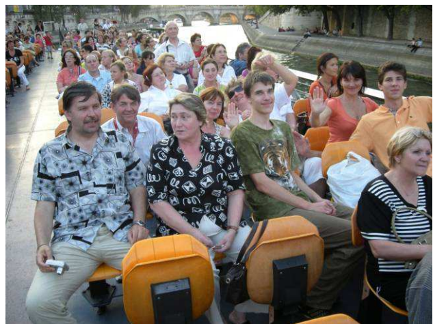
Schiffahrt auf der Seine.

Am Vormittag des nächsten Tages setzten wir die Stadtrundfahrt fort. Gegen Mittag nahm die Gruppe an einer Führung im Louvre Museum teil. Vor allem die Frauen unserer Gruppe hatten es danach eilig, in den nahe gelegenen Parfümerien ein paar echt französische Duftwässerchen als Souvenirs für ihre Freunde und Verwandten zu erstehen. Am Nachmittag fahren wir nach Versailles, wo wir das Schloss besichtigten und bei glühender Hitze die Gärten besuchten. Dann fahren wir nach Paris zurück, bummelten über die Champs-Élysées und aßen in einem der Restaurants. Zum Abschluss unseres Besuches in Paris nahmen wir an einer einstündigen Bootsfahrt auf der Seine teil. Dann stiegen wir in den Bus, um in der Nacht nach Darmstadt zurück zu fahren.