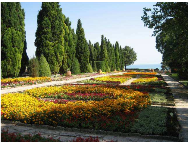
Schloss Baltchik in Bulgarien

Ein Besuch in eine frühere rumänische Kolonie führte uns zum Schloss Baltchik im heutigen Bulgarien, in den zwanziger Jahren Sommerresidenz der letzten rumänischen Königin, einer Enkelin des Zaren Alexander II und der englischen Königin Viktoria.