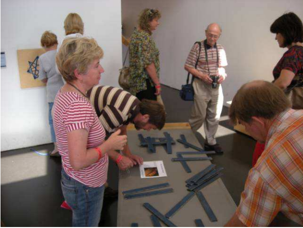
Die Experimente im Mathematikum faszinieren jeden.

warteten schon auf ihre russischen Partner. Nach dem Frühstück sind wohl die meisten Parisreisenden ins Bett gegangen, um den versäumten Schlaf nachzuholen. Am Abend trafen sich ein paar deutsche und russische Jumeleure im Bayerischen Biergarten in Darmstadt.