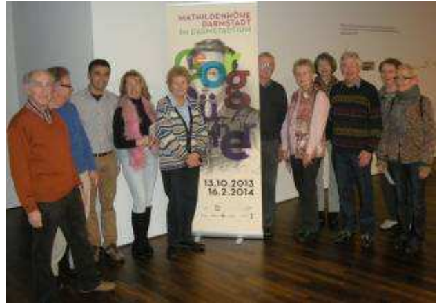
Jumeleure und Freunde der Jumelages vor der Ausstellung

21 Jumeleure und Freunde der Jumelages wollten das Besondere dieser Ausstellung kennenlernen und haben am 15. November 2013 an einer Führung durch die Ausstellung teilgenommen. Unsere Museumsführerin führte uns durch ein Labyrinth aus Treppen und Podesten, Wegen und Kabinetten und zeigte uns die Exponate: Originalmanuskripte, Multimediainstallationen, zeithistorische Objekte, Gemälde, Filmprojektionen und Hörstationen. Im Mittelpunkt stand eine Guillotine, die die Französische Revolution und Büchners Drama „Dantons Tod“ symbolisieren sollte.