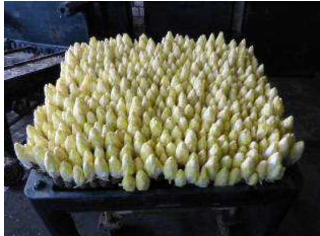
Ausgereifte Chicorée-Pflanzen, die zum Verkauf kommen.

lauf geführt und mit Nährstoffen angereichert wird. Nach etwa 20 bis 25 Tagen hat sich ein spindelförmiger Spross entwickelt. Die absolute Dunkelheit beim Treibprozess verhindert, dass sich der Spross grün färbt und sich unerwünschte Bitterstoffe entwickeln können.