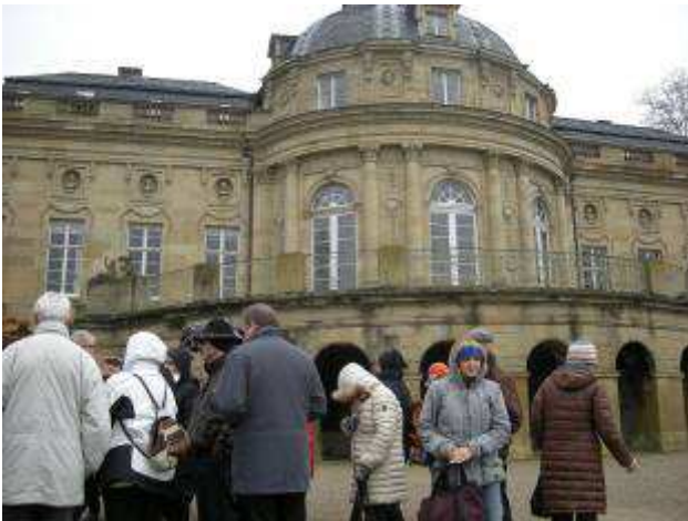
Vor dem Seeschloss „Monrepos“