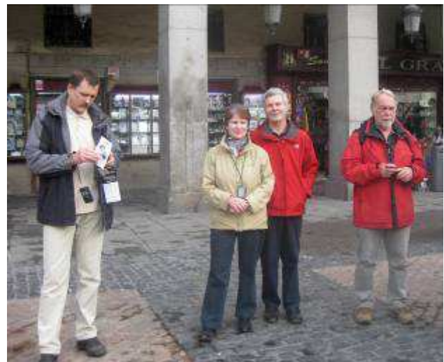
Auf der Plaza Mayor

schon unsere Führerin vom Vortag auf uns. Sie machte uns zunächst auf das Maul des Pferdes aufmerksam, welches heute geschlossen ist. Früher flogen nämlich Spatzen in das Pferdemaul, konnten im Innern aber die Flügel nicht mehr ausbreiten, um wieder herauszukommen.