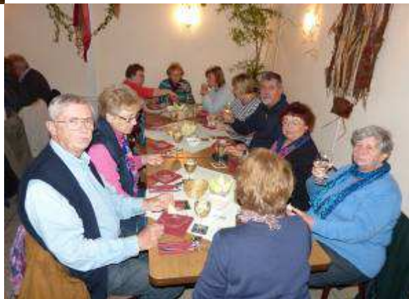
Weihnachtsmarkt in Ludwigsburg