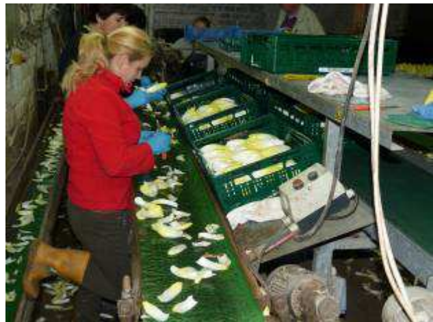
Vorbereitung für den Versand

Für den Vertrieb wird der Spross maschinell von der Wurzel getrennt, von unansehnlichen Blättern befreit und verkaufsfertig verpackt.