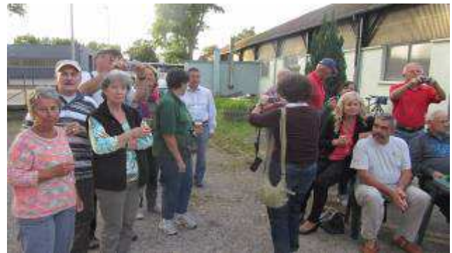
Alle warten auf die Sieger

Die erreichte Punktezahl aus jedem Spiel wurde den Spielern zugeordnet. So blieb bis zuletzt die Frage ungeklärt, wer denn nun die meisten Punkte erreicht hatte.