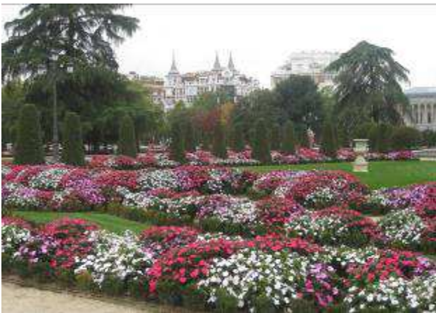
Blumenanlage im Retiro-Park

Durch einen der Zugänge verließen wir die Plaza Mayor und gelangten zur Markthalle Mercado de San Miguel, einem Bauwerk aus Glas und Eisen. Einst war es eine einfache Markthalle, heute ist es ein Gourmettempel. Die vielen Tapas sind uns besonders ins Auge gefallen. Vorbei am Teatro Real, der Oper, unweit des Schlosses gelangten wir zum Stadtviertel La Latina. Durch verwinkelte Gassen erreichten wir am Ende der Führung die Plaza de la Villa mit dem Ayuntamiento. Am Nachmittag stand eine Stadtrundfahrt mit dem Bus Madrid City Tour auf dem Programm. Jeder konnte ein- und aussteigen, wann und wo er wollte und so seine Besichtigungstour individuell gestalten.