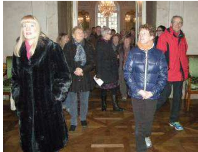
Bestaunen der barocken Pracht im Ludwigsburger Schloss

Von hier aus führen uns die beiden Stadtführer in zwei Gruppen durch die barocke Innenstadt und zeigen uns schließlich den Weg zu dem Restaurant „Rossknecht“ am Reithausplatz. Dort sind wir um 13:00 Uhr zum Mittagessen verabredet. Wir wärmen uns dort auf, essen schwäbische Spezialitäten und trinken Schwarzbier aus eigener Brauerei.