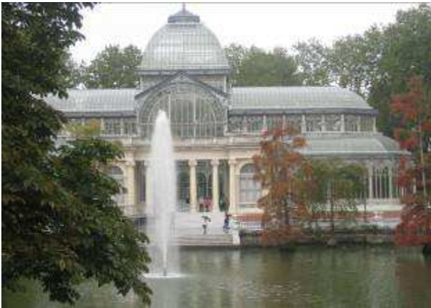
Kristallpalast im Retiro-Park

man das lebhaftes Treiben der Menschen und Gaukler beobachten.