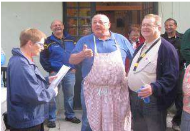
Die Vorbereitungen für das leibliche Wohl sind abgeschlossen

Man traf sich in Mulhouse auf einer Anlage der Union bouliste mulhousienn mit 14 abgesteckten Spielfeldern, einer Boulehalle, dem Boule-o-Drome, in dem ganzjährig gespielt werden kann und einem Clubheim mit Restaurant und Küche.