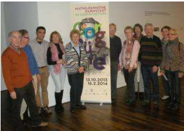
Besuch Büchner-Ausstellung im Darmstadtium